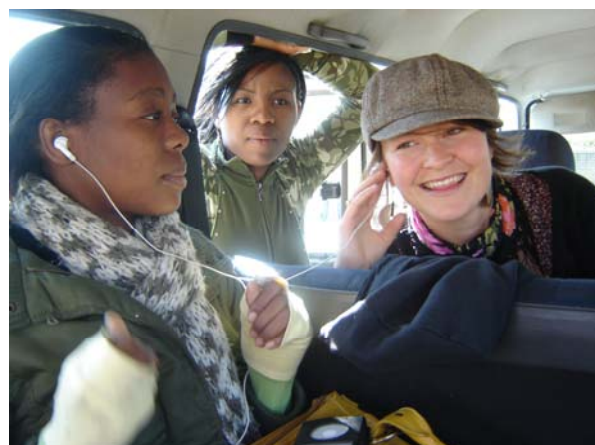
Unga kvinnor utbyter kreativa uttryckssätt och verktyg för att jobba för jämställdhet i NBV: s samarbetsprojekt "Teater för förändring".

I slutet av skriften finner du tips på material från Folkbildningsrådet och hänvisningar till mer detaljerad information om projektet, liksom kontaktinformation till deltagande eldsjälar. Lycka till!