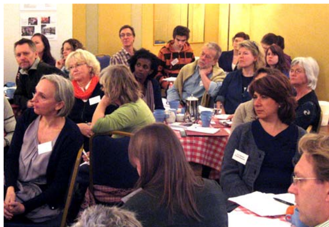
Koncentrerade lyssnare under berättarcaféet.