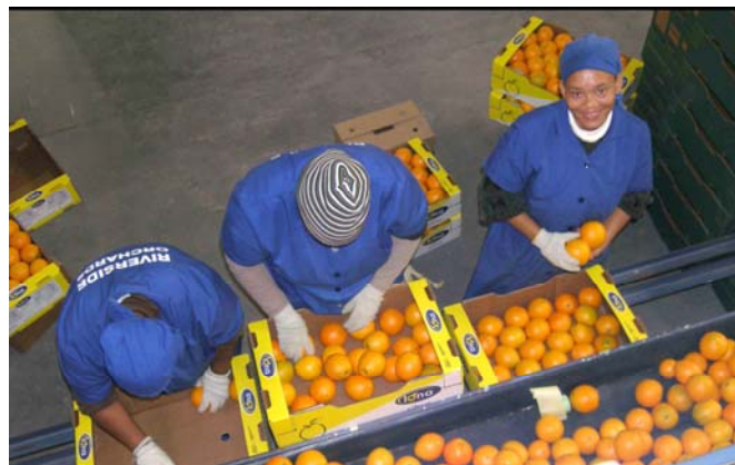
Nya rättvist handlade varor, här från River Side Farm, Fort Beaufort i Sydafrika.